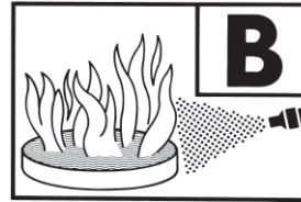
233 B = Typ F 6 GX AL