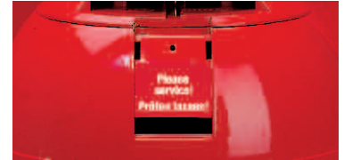
Abb. 1 Ziehen der gelben Sicherungslasche Abb. 2 Sehr langer Löschschauch Abb. 3 Rotes Sichtfeld