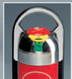
Abb. F 6 G